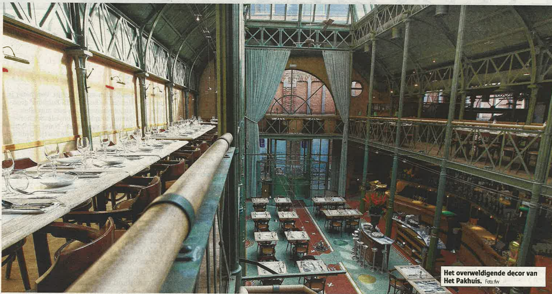
Het overweldigende decor van Het Pakhuis.